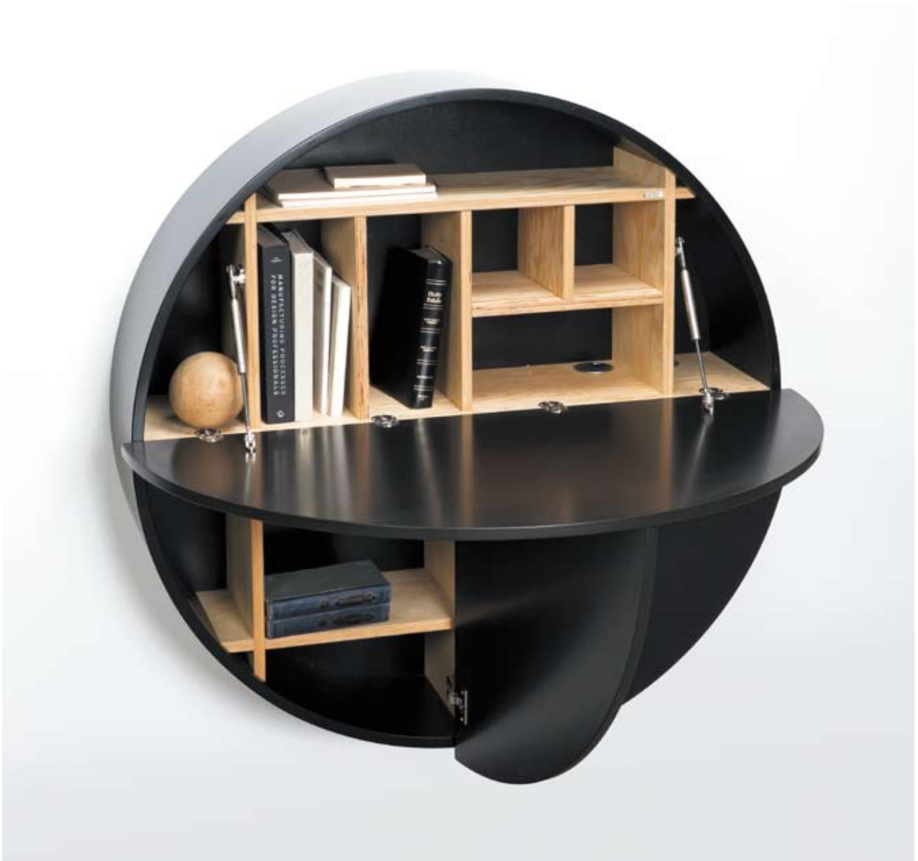
Dalius Razauskas (Lithuania)